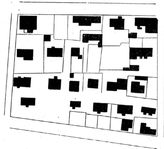
28. mynd. Byggingareitur á Ísafirði.

Sundurlaus húsaskipun, mjög óregluleg og óhentug.