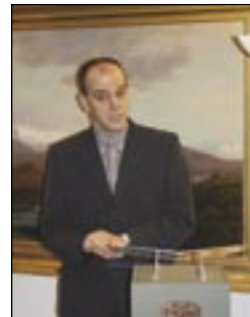
Höfundur bókarinnar þakkar fyrir sig og ráðherra hlakkar til að lesa bókina, nú er jólanóttinni bjargað.