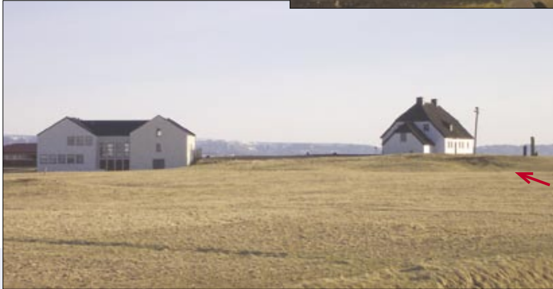
Í verðlaunatillögunni er gert ráð fyrir að nýbyggingin rísi þar sem örin bendir neðan við hólinn sem mun vera gamall sorphaugur.

ildir um sögu þjóðarinnar. Sum þessara beina eru með áberandi sjúklegum breytingum og væri edlilegast að varðveita þau í safni rannsóknarstofnunar sögu læknisfræðinnar, bæði sem sýningargripi og til rannsókna á sögu sjúkdómanna. Heilbrigðu beinin færi best á að þau yrðu áfram á vegum rannsóknarstofu í líffærafræði, en bæði beinasöfnin þurfa að vera aðgengileg til rannsókna.