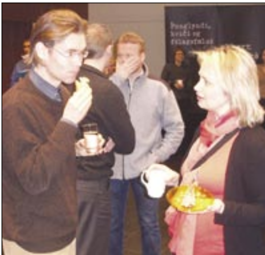
Og þessi fengu sér snarl en halda mætti að sá í miðjunni hafi talað af sér.