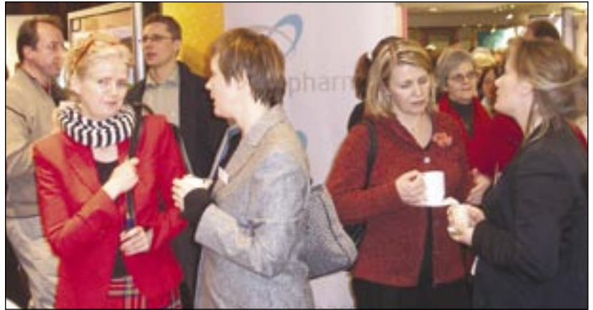
Það þurfti að skrafa um ýmislegt í kaffitímanum.