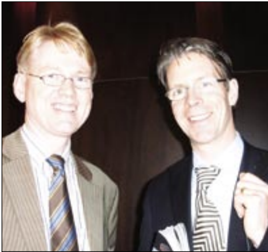
Pessir blönduðu geði og stungu saman nefjum.