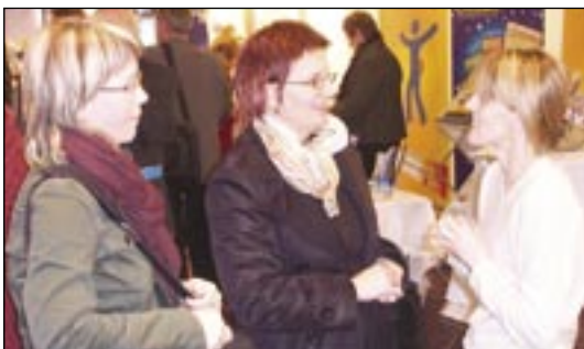
Sumum lá svo mikið á hjarta að þær gáfu sér ekki tíma til að fara úr kápunum.