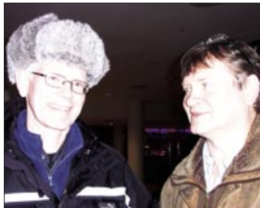
Þessir herra fengu myndatexta að eigin vali: „Yfirlýst par“.