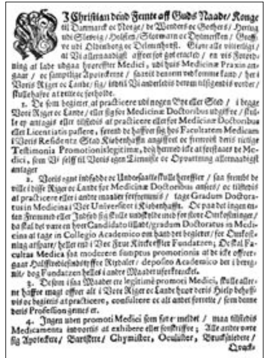
Mynd 1. Myndin sýnir upphafsgreinar tilskipunar Kristjáns konungs V. um lækna og lyfsala frá 4. desember 1672. Í 1. og 2. gr. ræðir um kunnáttu lækna og próf, og í 3. grein að einungis þeir sem hlotið hafi viðurkenningu sem læknar megji sinna læknisstörfum. Í 4. gr. eru réttindi lækna nánar skilgreind.

Undirbúningur laganna frá 1963 gekk ekki heldur áfallaust. Fyrst áttu tveir menn, Sigurður Sigurðsson (1903-1986), landlæknir, og forstjóri Trygg-