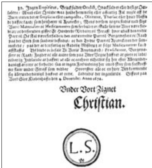
Mynd 2. Lokagreinarnar í tilskipun Kristjáns V. fjalla meðal annars um skil milli lækna og lyfsala og niðurlagsgreininni lýkur, eins og vera ber, svo: „Giffvet paa Vort Slot Kiöbenhaffn den 4. December: Anno 1672“ (tekid eftir Medicinalhistoriske dokumenter til belysning af lægevaesensets og pharmaciens udvikling i Danmark I (gefid út af H. Lundbeck & Co., Kaupmannahöfn, MCMXL) ).