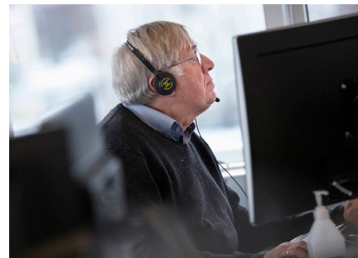
Sviþmyndir úr símaveri, ljósmyndir Þorkell Þorkelsson.