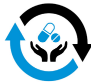
Öruggari tilfærsla meðferðar

Það er von þeirra sem standa að verkefninu Lyf án skaða að sú markvissa gæðaþróun sem er hafin á þessum vettvangi muni vekja áhuga meðal lækna, styrkja teymisvinnu og leiða á næstu árum til umbóta sem bæta öryggi í lyfjameðferð á Íslandi.