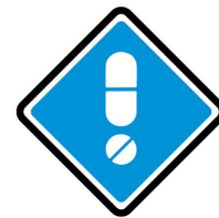
Bætt öryggi í notkun áhættusamra lyfja