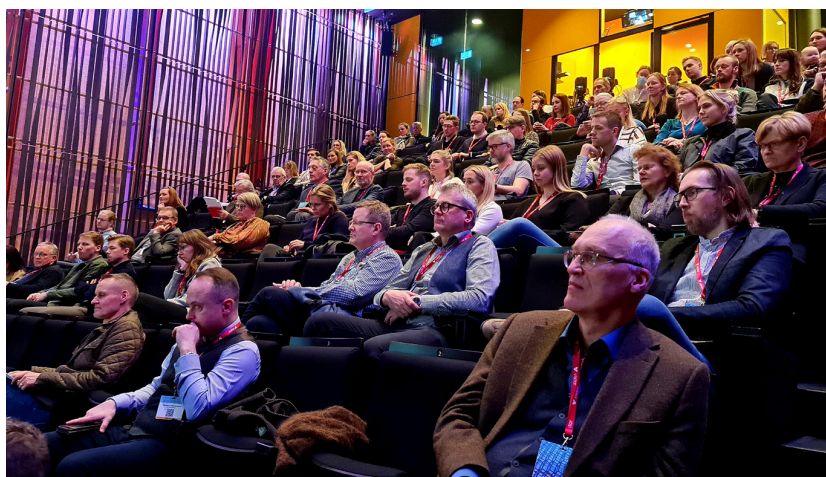
Gestir Læknadaga í Kaldalóni á fyrsta degi.