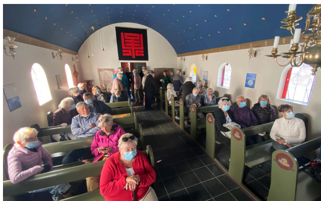
Í kirkjunni á Staðastað.