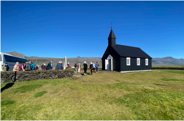
Kirkjan á Búðum.