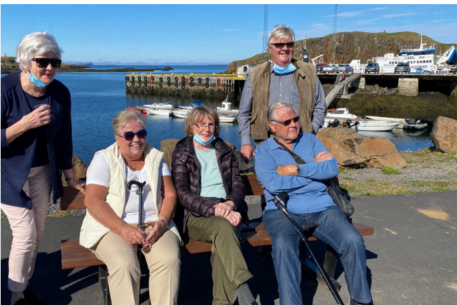
Við höfnina í Stykkishólmi.