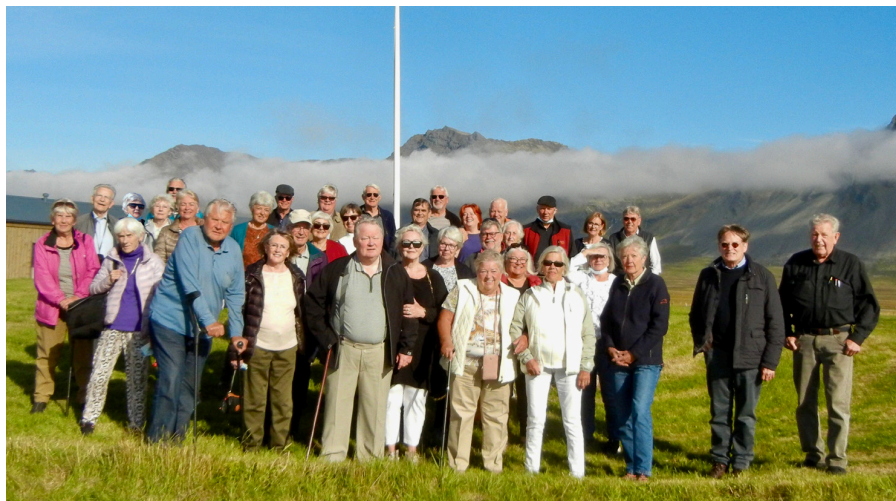
Hópmýnd sem tekin var við Langaholt í Staðarsveit.

Í kirkjugarðinum á Staðastað er svo kallaður Franski reitur þar sem grafnir